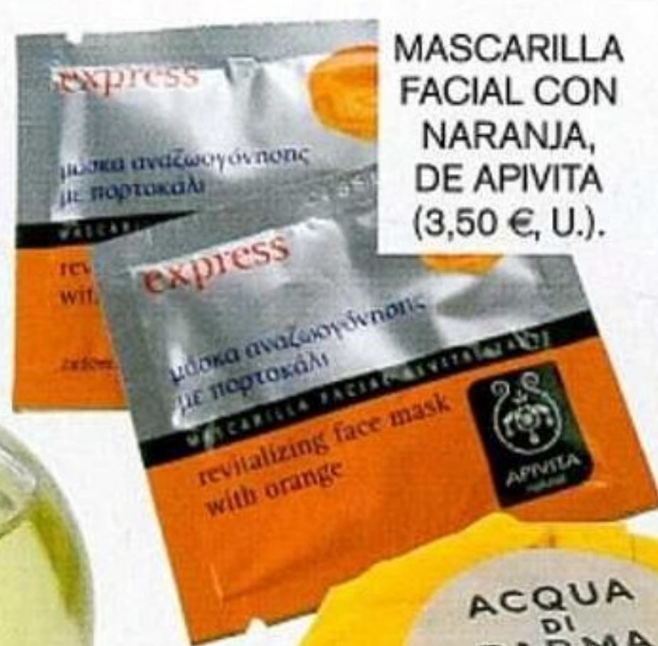
MASCARILLA FACIAL CON NARANJA, DE APIVITA (3,50 €, U.).