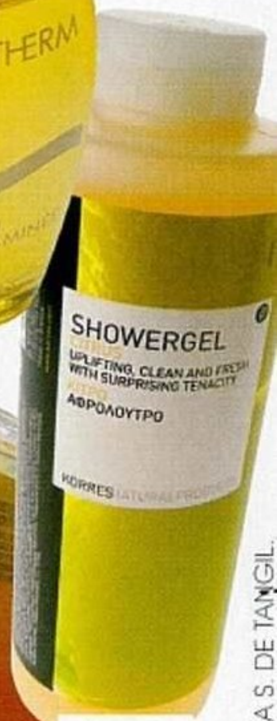
GEL DE DUCHA CITRUS, DE KORRES (9,80 €).