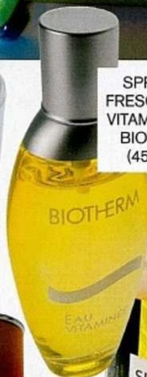
SPRAY DE FRESCOR EAU VITAMINÉE, DE BIOTHERM (45,75 €).