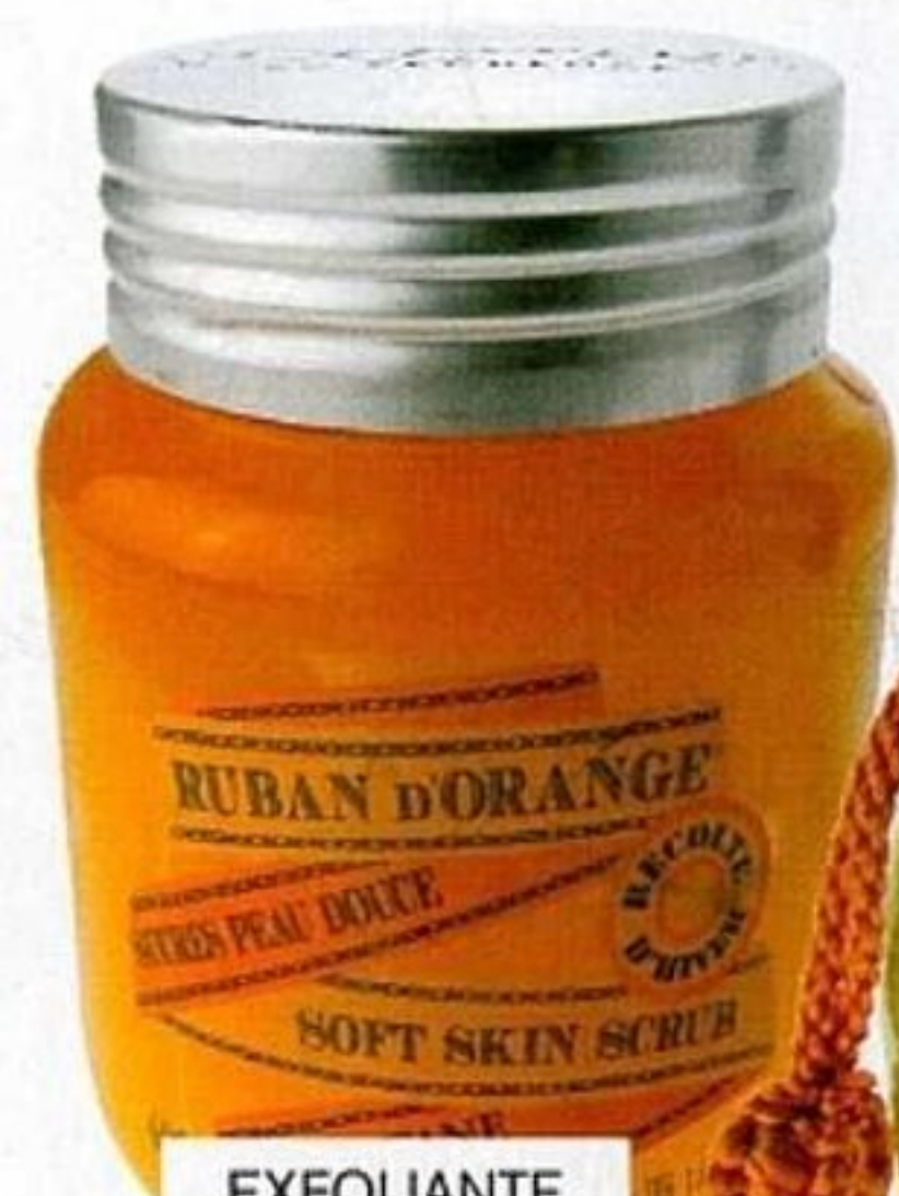
EXFOLIANTE RUBAN D'ORANGE, DE L'OCCITANE (26 €).