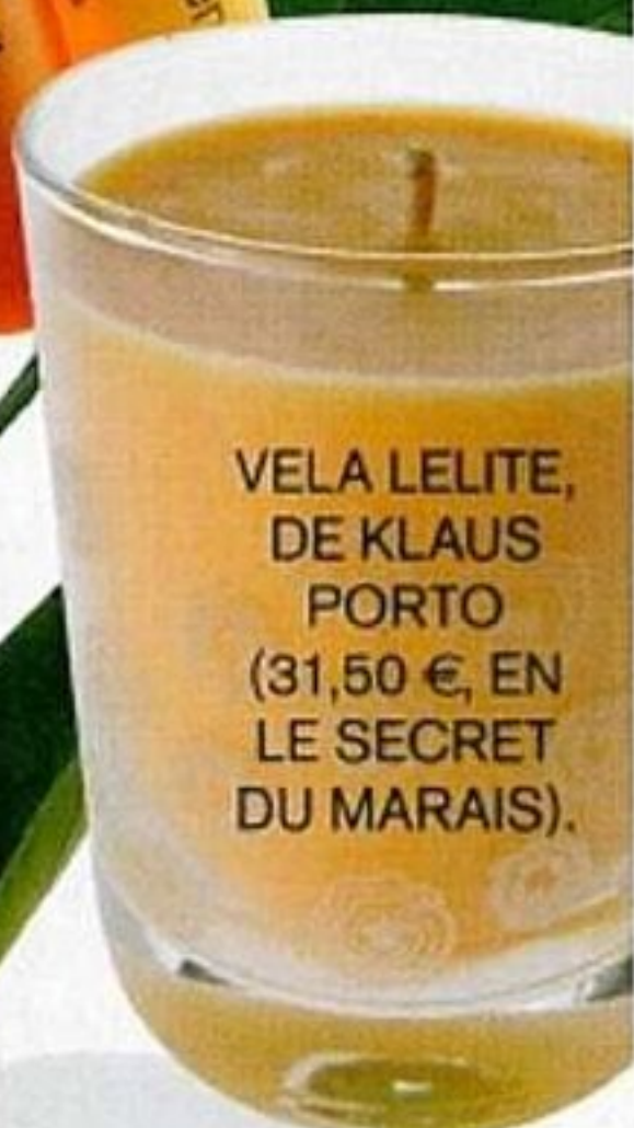
VELA LELITE, DE KLAUS PORTO (31,50 €, EN LE SECRET DU MARAIS).

N aranja, limón, pomelo o bergamota... sólo sus nombres nos trasladan ya a los días luminosos del verano, al paisaje mediterráneo y a los olores de nuestra infancia. No en vano forman parte de nuestra más enraizada cultura olfativa. Pero además de sus propiedades refrescantes y euforizantes que los hacen idóneos para perfumar el estío, como activos cosméticos poseen también excepcionales efectos revitalizantes. ■ C. L.