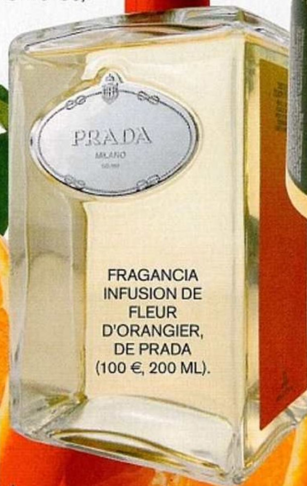
FRAGANCIA INFUSION DE FLEUR D'ORANGIER, DE PRADA (100 €, 200 ML).