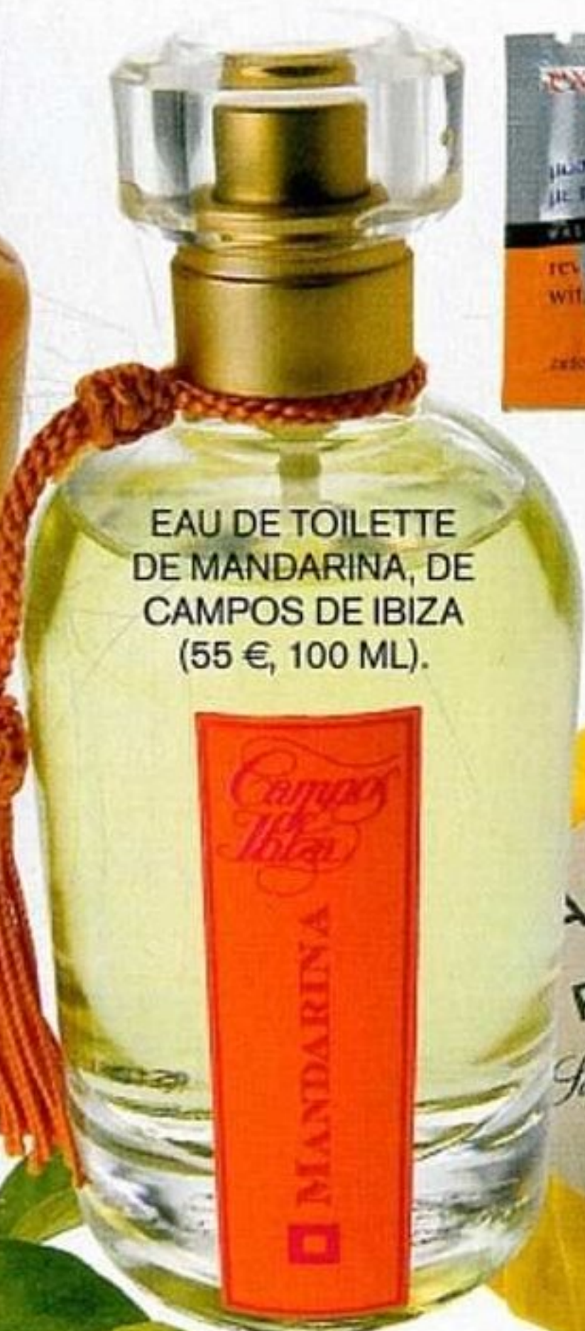
EAU DE TOILETTE DE MANDARINA, DE CAMPOS DE IBIZA (55 €, 100 ML).