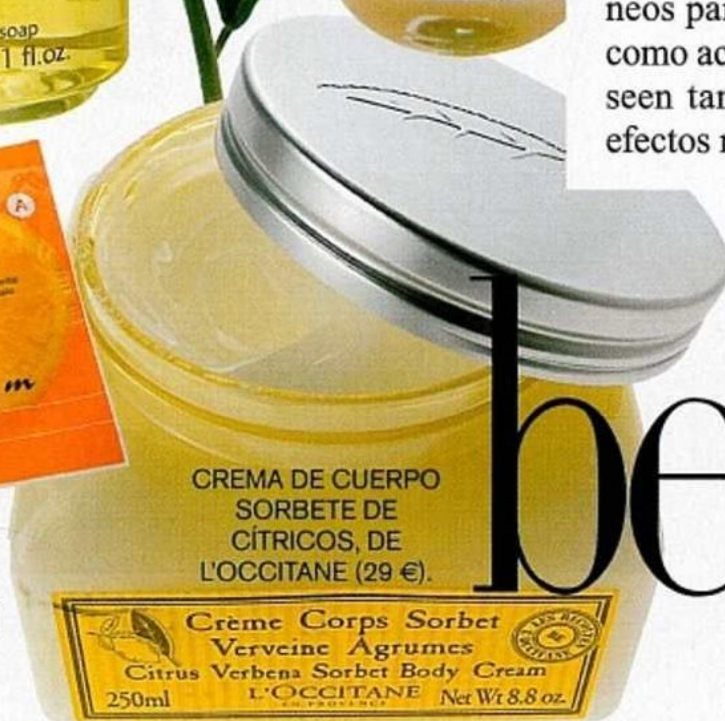
CREMA DE CUERPO SORBETE DE CÍTRICOS, DE L'OCCITANE (29 €).