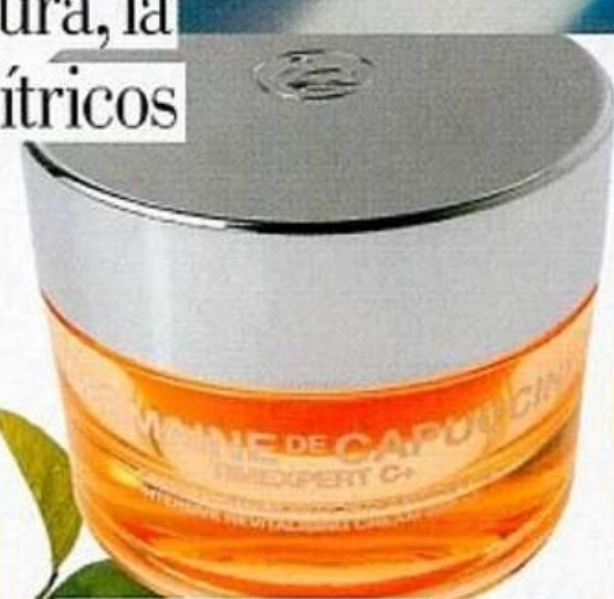
CREMA FACIAL TIMEXPERT C+, DE GERMAINE DE CAPUCCINI (37,75 €, EN INSTITUTOS).

N aranja, limón, pomelo o bergamota... sólo sus nombres nos trasladan ya a los días luminosos del verano, al paisaje mediterráneo y a los olores de nuestra infancia. No en vano forman parte de nuestra más enraizada cultura olfativa. Pero además de sus propiedades refrescantes y euforizantes que los hacen idóneos para perfumar el estío, como activos cosméticos poseen también excepcionales efectos revitalizantes. ■ C. L.