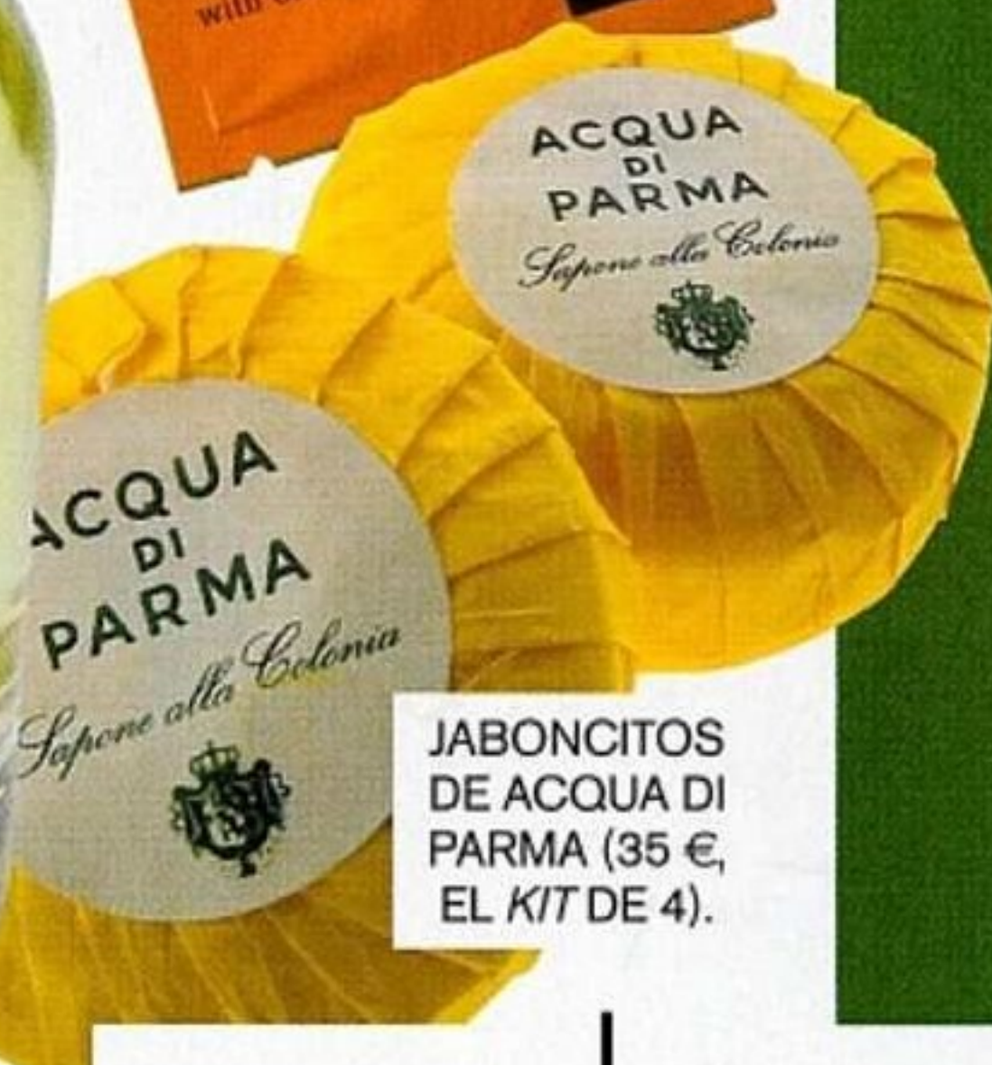
JABONCITOS DE ACQUA DI PARMA (35 €, EL KIT DE 4).