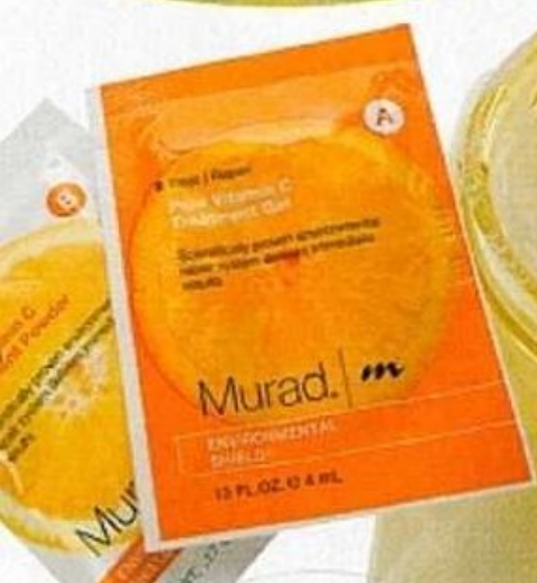
GEL DE VITAMINA C, DE DR. MURAD (EN SEPHORA).